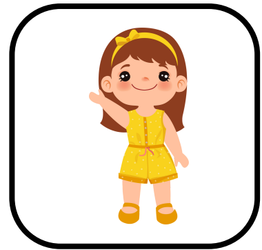
Saludo al ingresar a mi aula.