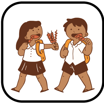
Comparto con mis compañeros.