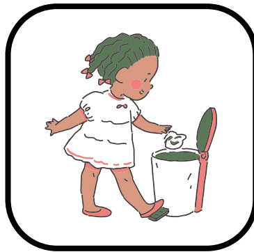
Uso el tacho de basura.