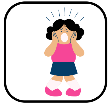
Hablo gritando a mis compañeros.