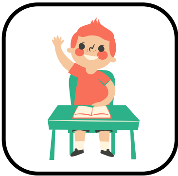
Levanto la mano antes de hablar.